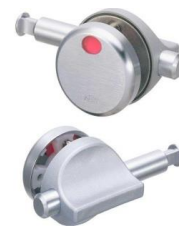
No.610NH 打掛錠 開戸引戸兼用