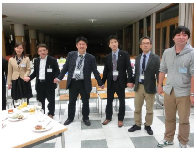
手を繋ぎ輪になって