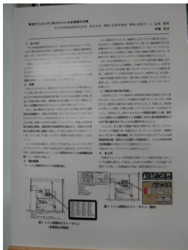
東京オリンピックに向けたトイレの多言語化対策