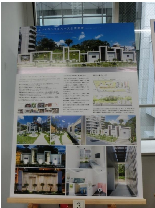
緑ヶ丘エントランススペース公衆便所

以上の7作品の他にも、さまざまな問題意識に裏打ちされた応募作品を見ると、トイレは社会を写す鏡だと改めて実感させられます。世界一と云えるかどうかはともかく、極めて高度に発展しているわが国のトイレがさらなる高みを目指すために、皆様の更なるご尽力をお願いするとともに、手間を惜しまずパネルを制作して応募して下さった皆様に深く御礼申し上げます。（東洋大学教授）