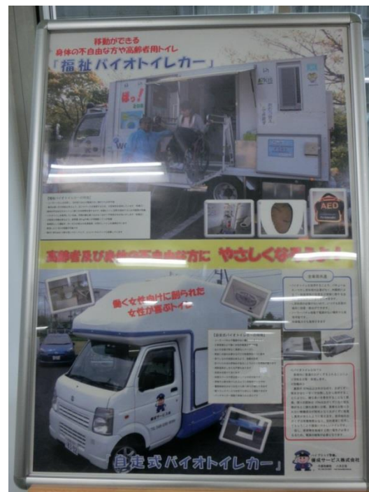
移動ができる身体の不自由な方や高齢者用トイレ 「福祉バイオトイレカー」