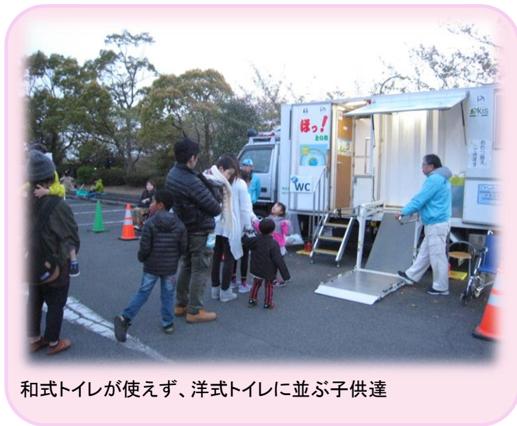
和式トイレが使えず、洋式トイレに並ぶ子供達

身体の不自由な方のトイレ環境を整えることで、外出できるきっかけになり、家族や施設関係者なども外出することで、ココロもカラダもリフレッシュできると思います。