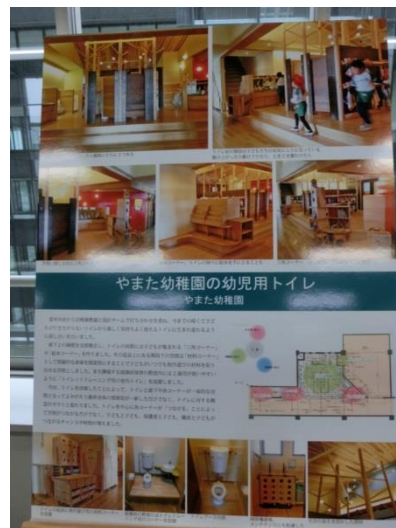
やまた幼稚園の幼児用トイレ