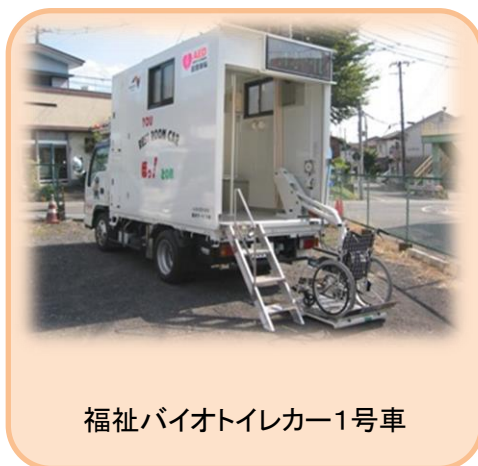
福祉バイオトイレカー1号車

高齢者や障がい者の為に省資源・環境保全を図る福祉バイオトイレカーを開発したことが評価され、平成23年6月には、えびな環境大賞奨励賞を、平成23年7月には、第2回かながわ産業Navi大賞奨励賞を受賞しました。