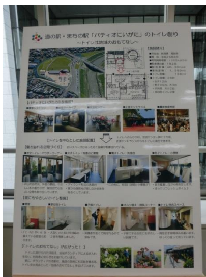
道の駅・まちの駅「パティオにいがた」のトイレづくり