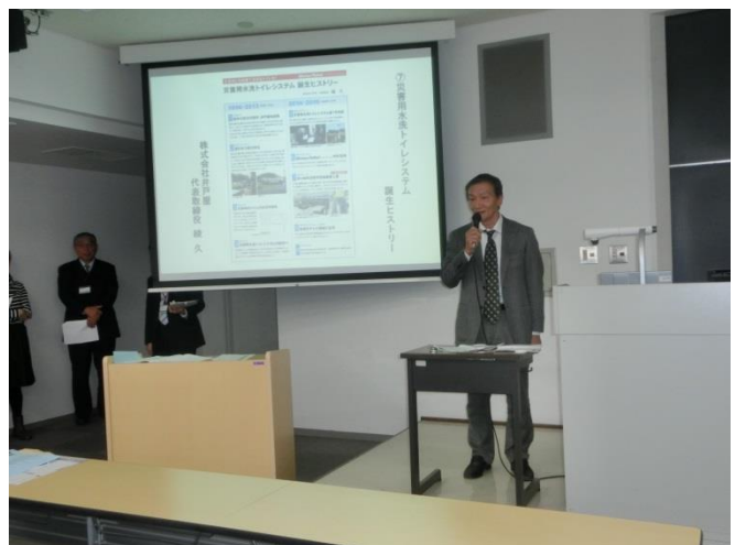
グッドトイレ選奨のプレゼンテーション風景