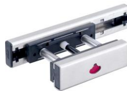
No.1612SL 表示付ボルト 定番スタンダードモデル