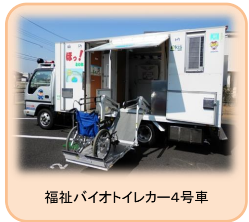
福祉バイオトイレカー4号車

平成 24 年 5 月には、国土交通省 北陸地方整備北陸技術事務所にて国土交通省所有の真空式装置のトイレ車両とともに、弊社の福祉バイオトイレカーの内覧会を実施。福祉バイオトイレカーは国土交通省の監修を受けた車両です。