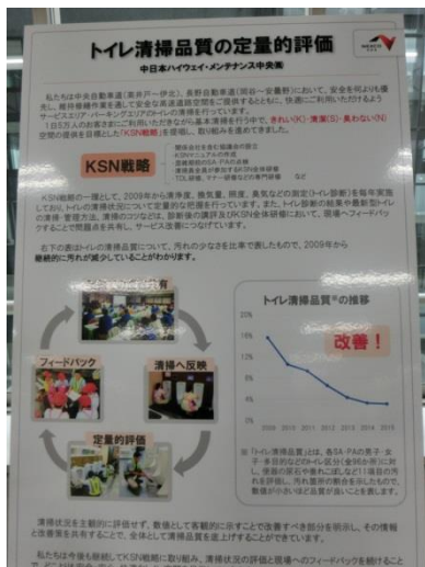
トイレ清掃状況の定量的評価及び清掃現場へのフィードバック