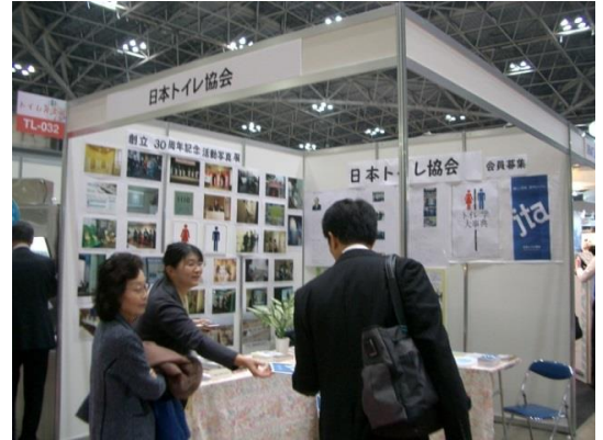
日本トイレ協会の出展ブース