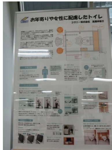
お年寄りや女性に配慮したトイレ