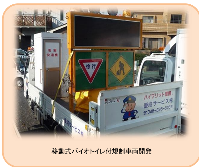
移動式バイオトイレ付規制車両開発

仮設トイレは、設置から撤去までに日数がかかり臭いも発生する為、近隣に迷惑がかかります。そこで作業員への負担を減らすため、トイレが簡単に移動・撤去ができる方法はないかと、トイレ付き車両の研究開発を始めました。そして規制車両にバイオトイレを載せた「移動式バイオトイレ付道路規制車両」が平成20年に完成。バイオトイレを使用することで内閣府による「一般廃棄物の処理及び清掃に関する法律政令施行令一般廃棄物の収集・運搬の基準」をクリア、おがくずが糞尿を一次処理する為、し尿処理の必要がなく公道を走ることが認められ、作業員の負担が軽減されました。