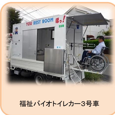
福祉バイオトイレカー3号車