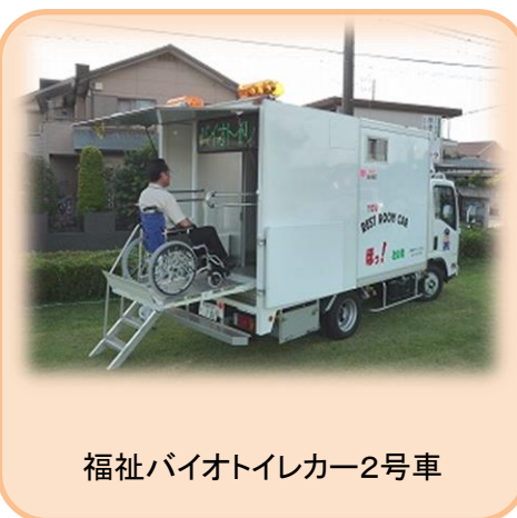
福祉バイオトイレカー2号車